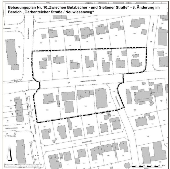
Ausschnitt genordet, ohne Maßstab