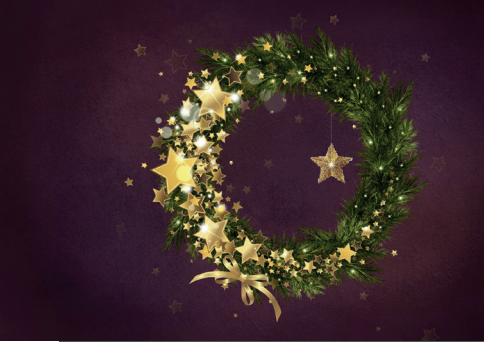
Die Stadt Lich wünscht frohe Weihnachten

Angesichts der Vielzahl und Breite der Investitionen stellt sich die Frage, von wem diese alle gestemmt werden können. Selbstverständlich stecken hinter einem Großteil der Investitionen Be-