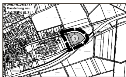
Ausschnitt genordet, ohne Maßstab